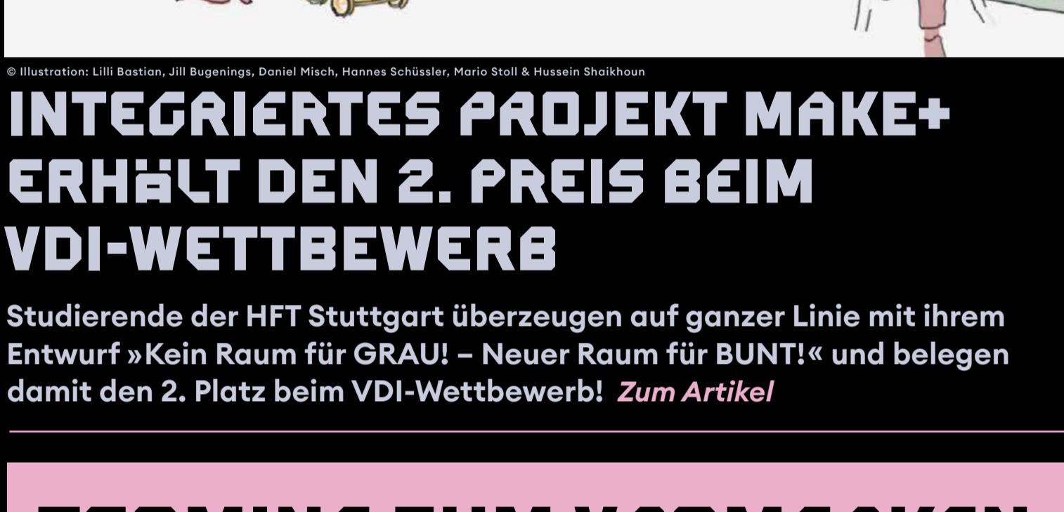
© Illustration: Lilli Bastian, Jill Bugenings, Daniel Misch, Hannes Schüssler, Mario Stoll & Hussein Shaikhou

Auszeichnungen für ein Hochschulprojekt mit Strahlkraft Das Reallabor »Jugendtreff Ingersheim« wurde 2024 im Rahmen eines internationalen Workshops des Masterstudiengangs Innenarchitektur erstellt. Zum Artikel